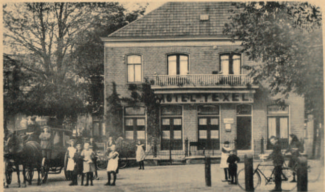
Hotel „Texel“, den Burg (Texel).