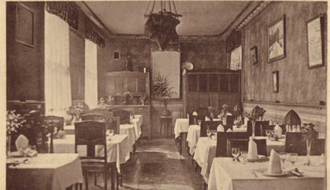
DEN BURG TEXEL. Hotel „De Lindeboom“. Eetzaal