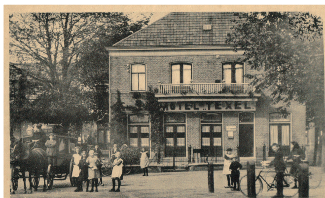
Hôtel „Texel“, den Burg (Texel).

Perlencouscous mit Vadouvan-Gewürzen, Kichererbsenfalafel und Knoblauchsauce