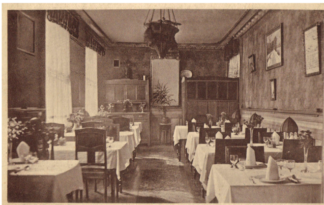
DEN BURG TEXEL. Hotel „De Lindeboom“. Eetzaal